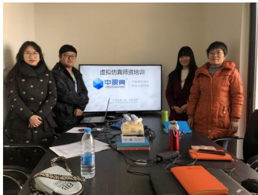
图 4 合照