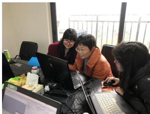
图 2 项目实训