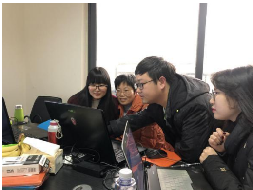
图 3 项目实训指导