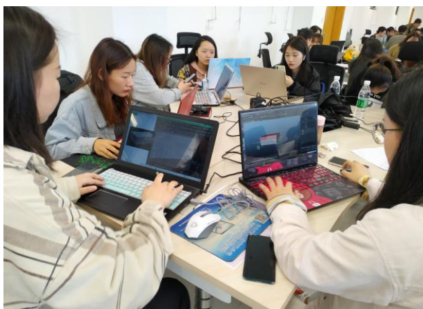
学生认真完成建模作业