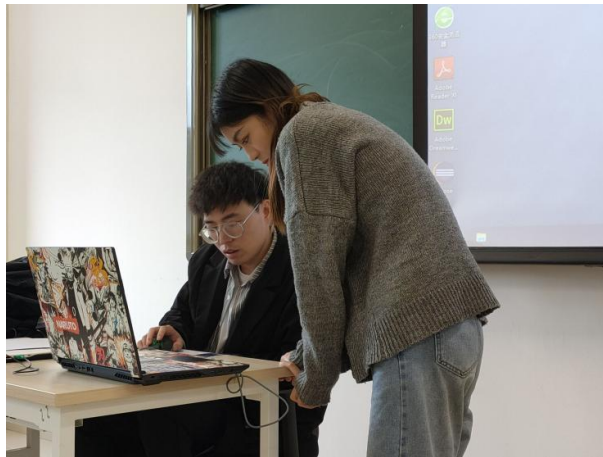
企业导师对学生进行一对一建模指导