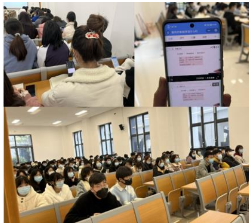
图 5 返校同学“面对面”上课情况