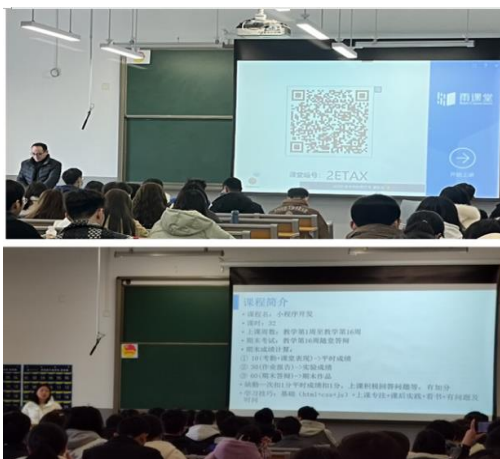
图 4.教师“面对面”+直播授课情况