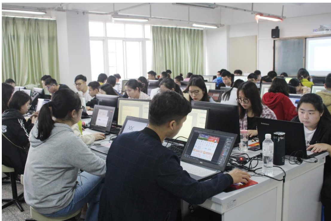
在老师指导下认真做设计的同学们