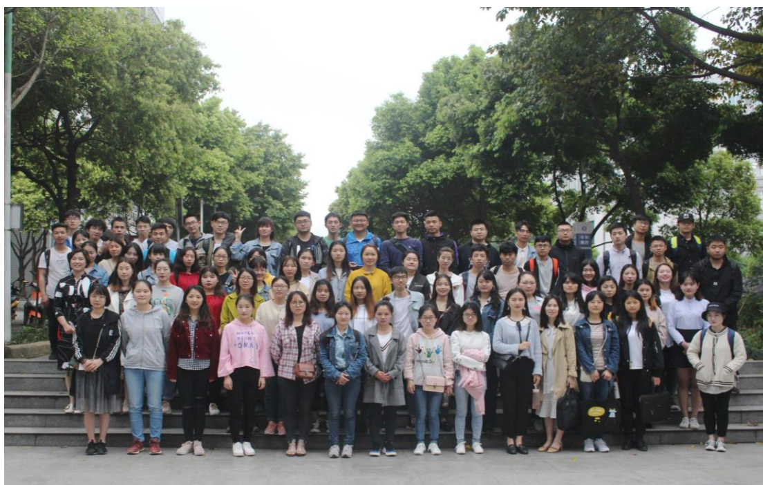
老师和学生的集体合照