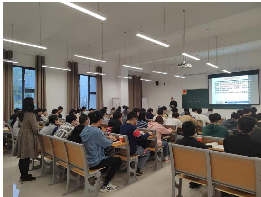
图 3 教师“面对面”+直播授课情况

课堂上“面对面+直播”教学得以顺利开展，按时返校同学根据疫情防控要求进行“面对面”学习，因疫情暂缓返校的同学也通过雨课堂直播进行“直播”学习，我部教学管理办公室将开学准备工作落到实处，有效地保证了新学期教学工作的顺利运行。