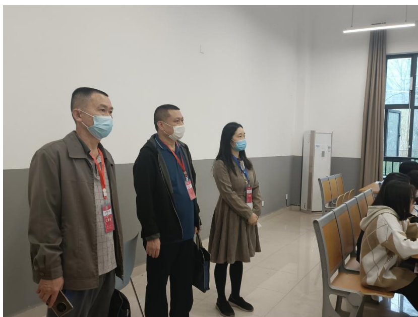
图 1 教学检查情况

2022年10月24日上午8:40, 学校督导陈斌、刘刚、我部部长覃凤清及我部部分督导成员一行到临港校区6号楼对本学期第一次线下教学情况进行了检查。