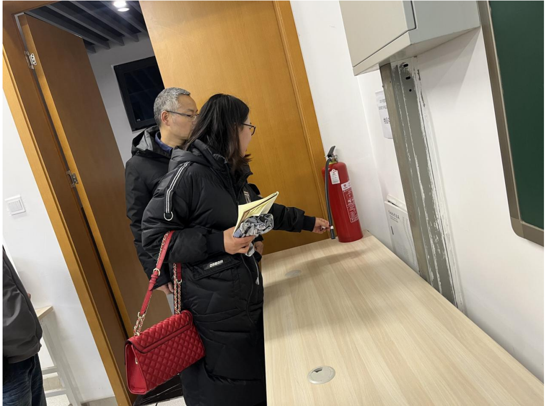
曾安平副部长等对 6 号楼教室进行设施安全检查