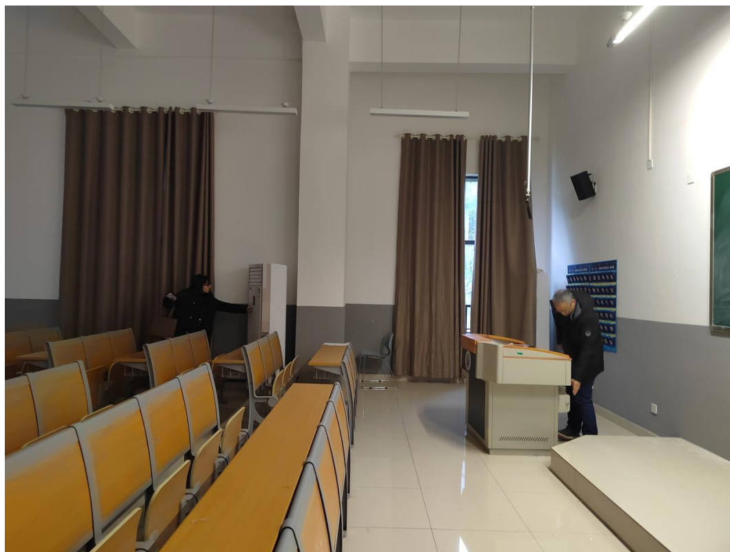
曾安平副部长、朱利红主任对 6 号楼教室进行设施安全检查

2022 年 2 月 21 日上午 10 点，人工智能与大数据学部副部长曾安平、教学办主任朱利红、实验中心主任游应德等汇同国资处郭兰老师，对临港校区 6 号楼、A 区 8 楼每间教室、实验室逐一进行开学前教学楼内外的设施安全检查。