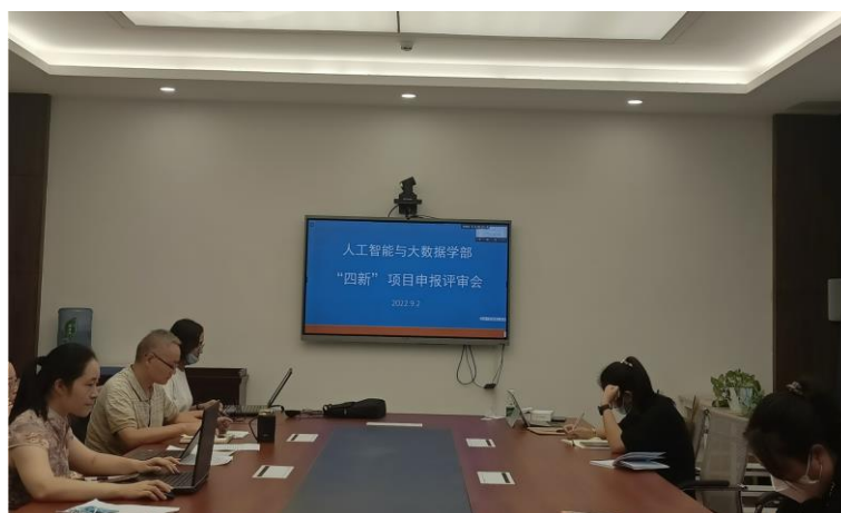
图 1 我部召开“四新”研究与实践项目申报评审会

2022 年 9 月 2 日下午 3:00，人工智能与大数据学部在临港校区 2 号楼 2415 会议室召开“四新”研究与实践项目申报评审会。会议由教学副部长曾安平主持，李忠书记、覃凤清部长、督导组部分成员以及项目申报人员参加了此次会议。由于疫情原因，此次会议为线上线下混合开展，暂缓返校教师线上参与了本次会议。