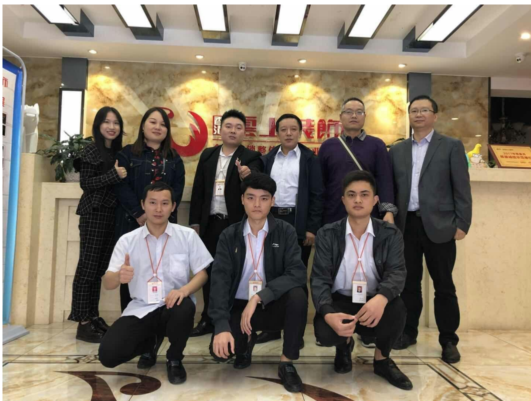
图 2. 我院领导、教师与实习学生及负责人合影

随后检查的是理想网络科技有限公司。在该公司实习的三位同学演示了在企业指导老师指导下正在开发的软件系统。从演示情况看，同学们得到了较好的实践锻炼，真正体现了实习基地的校企合作价值。