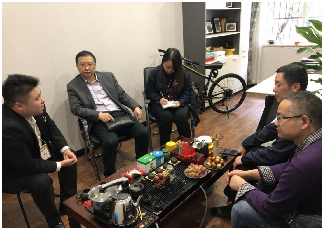
图 1 我院领导与实习单位负责人进行座谈交流

首先检查的是宜宾香港云上装饰有限公司，在该公司领导交流中，我们了解到实习单位为实习学生们量身定制了实习计划，在行业素养、与客户沟通能力等方面对学生们进行良好的培养，使学生们获得了宝贵的实践经验。据用人单位反映，我院实习生在实习过程中态度端正，纪律良好，工作积极肯干，高质量地完成了公司分配的各项任务，并为公司带来了良好的效益。