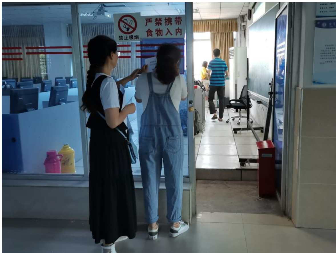
图 4. 答辩前准备工作

我部本届网络答辩多采用 QQ 群平台，部分答辩小组使用 QQ 群与腾讯会议相结合，在论文答辩前，为保证答辩的顺利进行，各答辩小组还进行了平台演练,以便保证保量完成网络答辩工作，目前答辩正有序进行中。